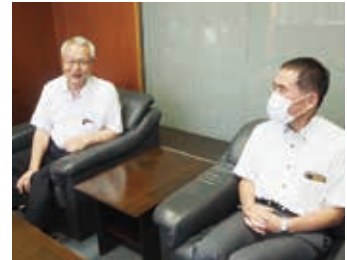
小坂常務も加わり対談