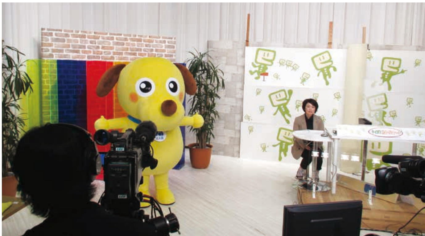
法人会キャラクター「けんたくん」TV初出演!