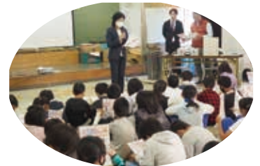
絵はがきコンクール募集

も今年行き先が県内となり税金の流れ、使い道等現地に学ぶことができない分、法人会青年部では昨年のマニュアルをさらにバージョンアップさせ、理解させるのではなく理解してもらう租税教室ができました。