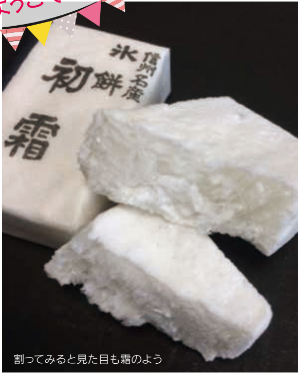
割ってみると見た目も霜のよう