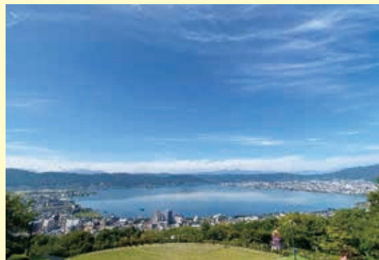
コロナ禍を一瞬でも忘れさせてくれる、爽やかな諏訪湖