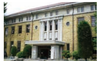
岡谷市制施行時に落成となった旧庁舎 昭和11年～昭和62年(開庁)

今回、3年を要した「100周年記念誌」を拝読し、県、市町村の重要な公共物を手掛けられており驚きました。私たちの納めた税金が安心、安全な社会の構築に生かされている事、また作り手側には常に夢、プライドがあることに感動致しました。