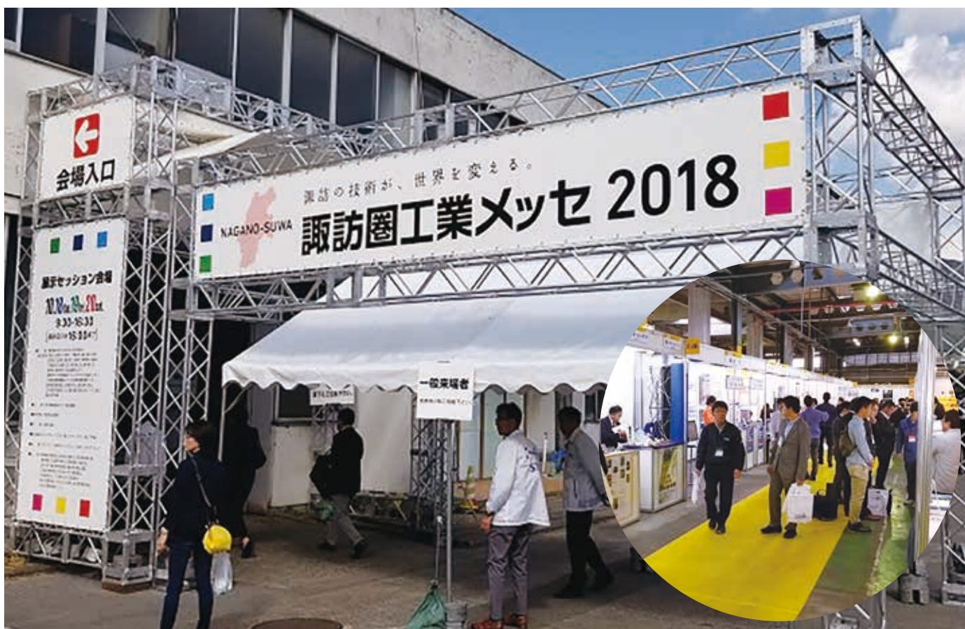
地方開催の工業展示会として国内最大級となった工業メッセ