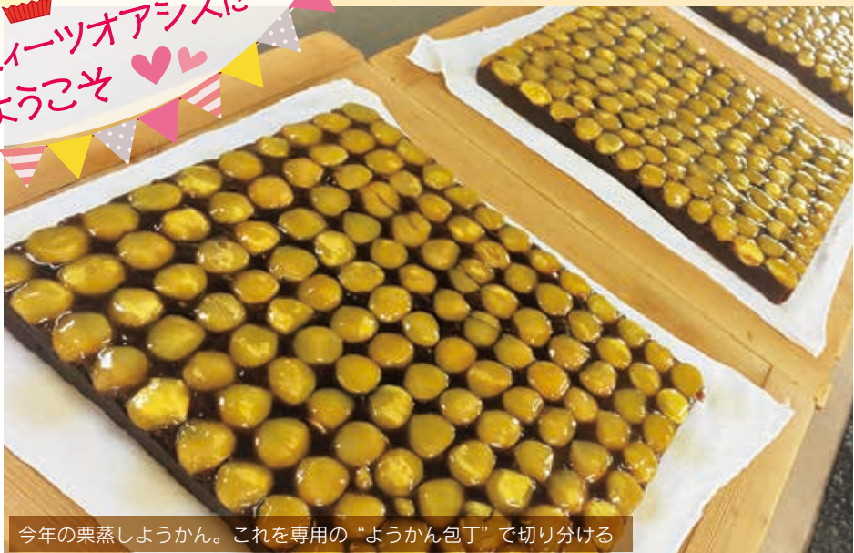
今年の栗蒸しようかん。これを専用の“ようかん包丁”で切り分ける