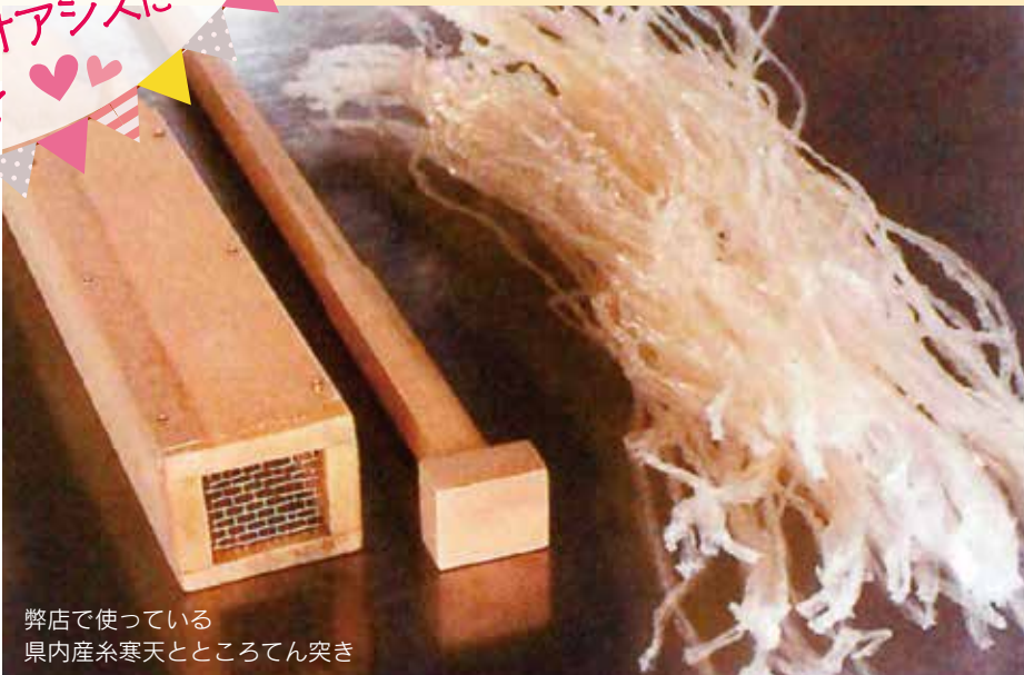
弊社で使っている 県内産糸寒天とところてん突き