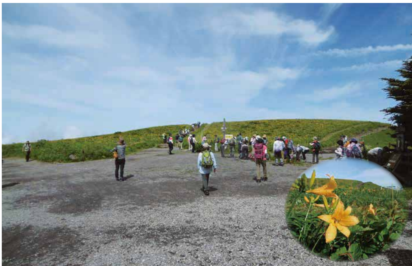
ニッコウキスゲへ向かってサア！出発