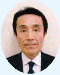
諏訪税務署長 上杉 陽一