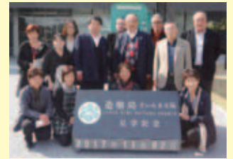
茅野支部(11/2~11/3) 造幣局さいたま支局 13名参加

実際に自分たちの使っているお金の製造現場を見学でき、とても意義ある視察になったと思います。