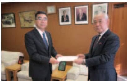
野村税制副委員長から茅野市長へ

昨年、「税を考える週間」が始まる前の週に、税制委員が中心となり、3市の首長と面談、意見交換を致しました。又2町1村の首長並びに6市町村の議長へは窓口を通じ持参し手渡しました。