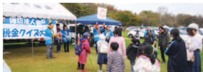
台風の影響で雨天ではありましたが、約250人が参加