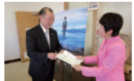
伊東税制委員から諏訪市長へ