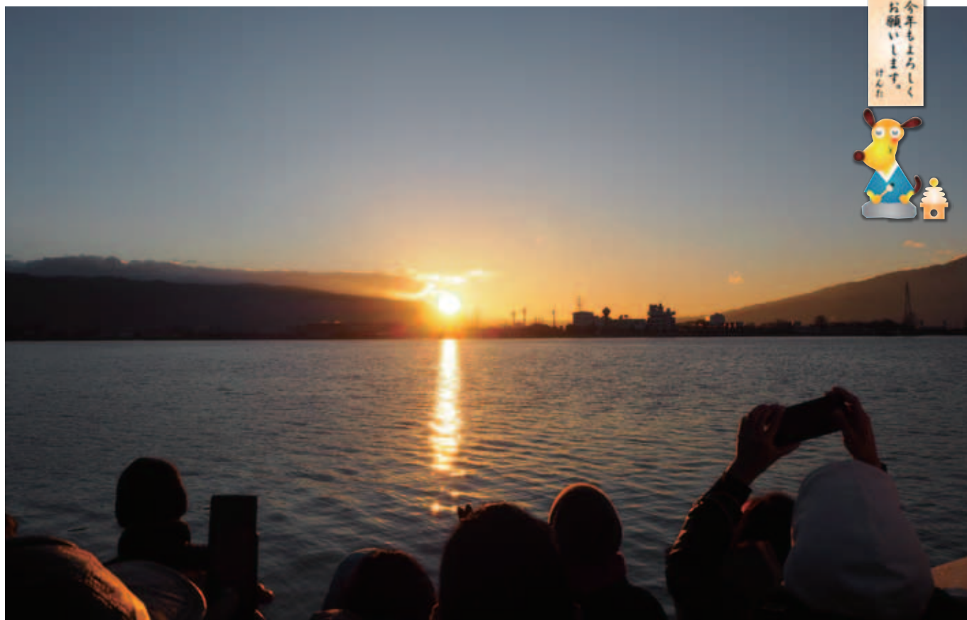
平成30年元旦 諏訪湖上からの初日の出「はくちょう丸船上より:7時11分」