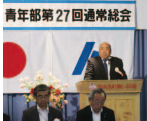
再任された深井部長