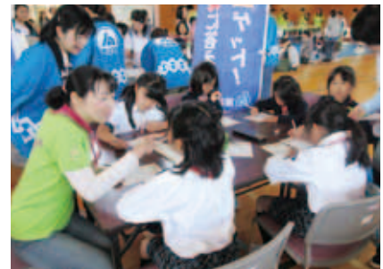
教えて！自分で考えて！真剣な親子

10月28(土)・29日(日)の両日、「原村・まるごと収穫祭」で、「税金クイズ」のブースを、女性部の後援をいただき出展しますので、是非遊びに来てください。