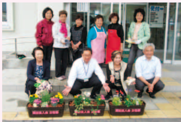
植え込み後署長、副署長と…