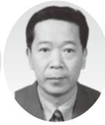
西村副会長 (富士見支部長)