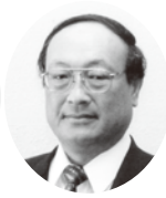
朝倉副会長 (茅野支部長)