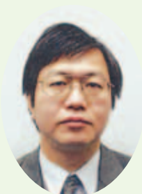
名取 公仁 統括官