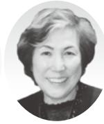
宮澤副会長 (女性部長)