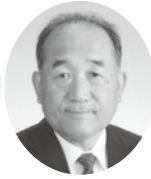
林副会長 (岡谷支部長)