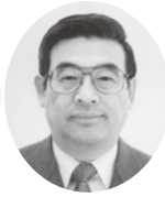
高山副会長 (諏訪支部長)