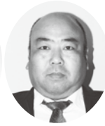
深井副会長 (青年部長)